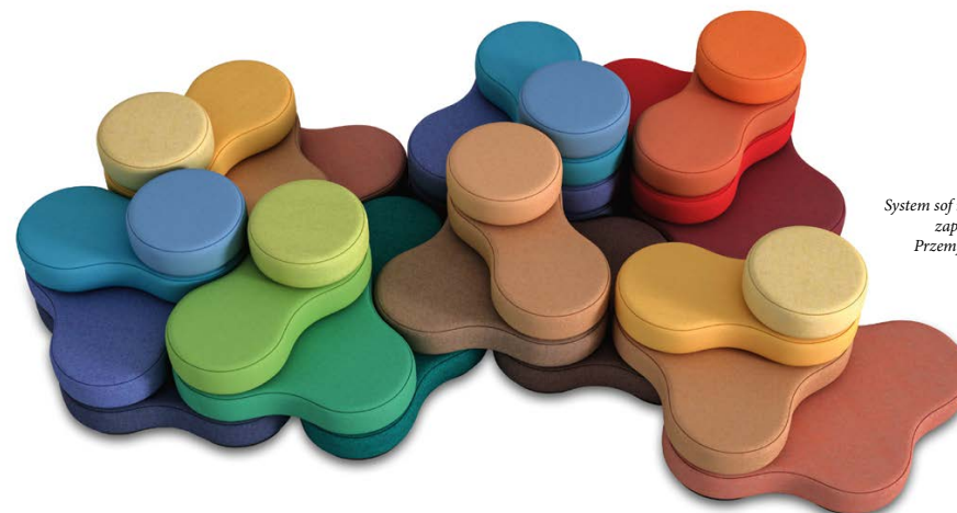
System sof modułowych Tapa zaprojektowany przez Przemysława Mac Stopę.

narzędzia potrzebne do zaimplementowania ich w konkretnej rzeczywistości. Nasz Dział Badań i Konsultingu Przestrzeni Pracy dysponuje wiedzą i zespołem ludzi, który na zlecenie klienta może przeprowadzić m.in. badania stylu pracy (zdefiniowanie aktywności pracowników) oraz analizę efektywności przestrzeni. Dopiero dogłębna analiza pozwala przygotować indywidualny projekt wykorzystujący powierzchnię w optymalny sposób. – To ogromne pole do współpracy pomiędzy Grupą Nowy Styl i architektami. Wspólnie jesteśmy w stanie przygotować projekt maksymalnie odpowiadający potrzebom. Architekci, tworząc koncepcję aran-